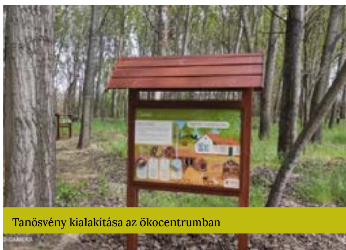
Tanösvény kialakítása az ököcentrumban