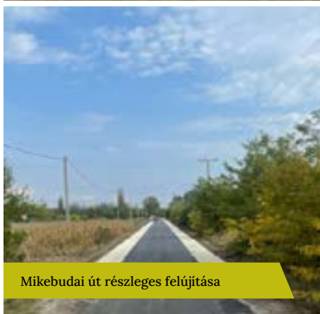
Mikebudai út részleges felújítása