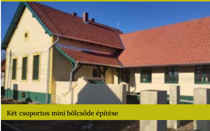
Két csoportos mini bölcsőde építése