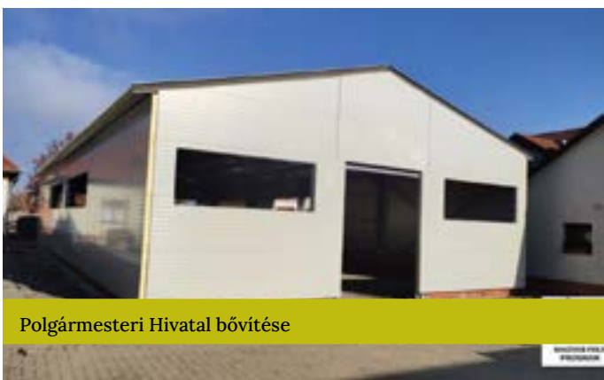
Polgármesteri Hivatal bővítése