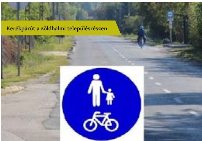
Kerékpárút a zöldhalmi településrészen

Nyertes pályázatunk van és megvalósításra vár