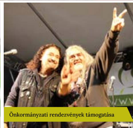
Önkormányzati rendezvények támogatása