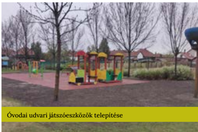
Óvodai udvari játszóeszközök telepítése