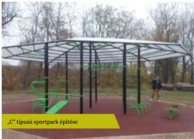
„C” típusú sportpark építése