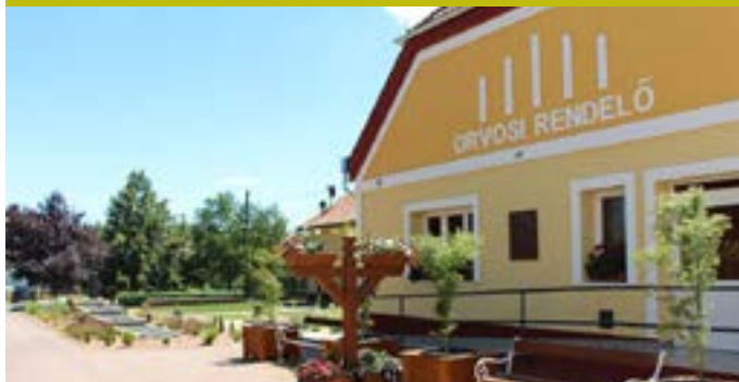
Központi rendelő gyermekorvosi részének energetikai felújítása